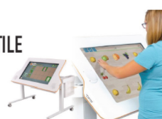
TABLE DE RÉÉDUCATION TACTILE à Trestel